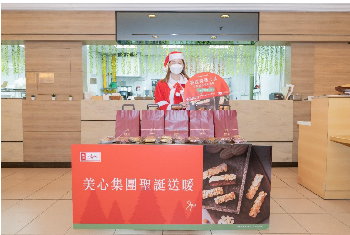
照片三：美心集團派發聖誕福袋，送上暖意及祝福。